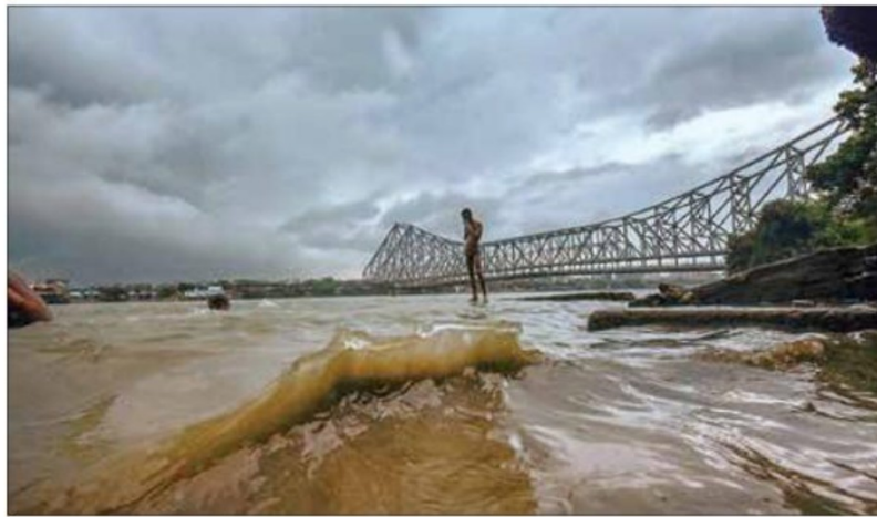
Storm-like weather conditions near Howrah Bridge, on Monday

At a video conference held with the chief ministers of Andhra Pradesh, Odisha and West Bengal and the Lieutenant Governor of Andaman and Nicobar Islands, besides officials of concerned ministries, the minister said a 24x7 control room is functioning in the MHA, which can be contacted by them any time for assistance.