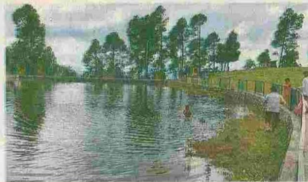
दो हजार फीट से अधिक ऊंची लमकेश्वर पहाड़ी पर वर्षा जल संग्रहण कर बनाया गया है यह जलाशय • जगराण

जलाशय बनते ही पर्यटन को भी लगे पंख, जलस्रोत हुए रिचार्ज, खेत और जानवरों की भी बुझ रही प्यास