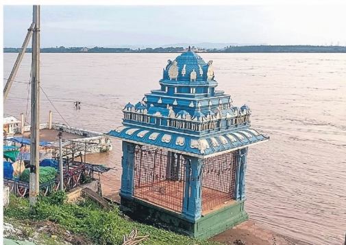
The water level in the Godavari at Bhadrachalam, which had reached 56 ft on Saturday, came down to 50.40 ft on Sunday.

A memorandum from the Ministry on the deputation