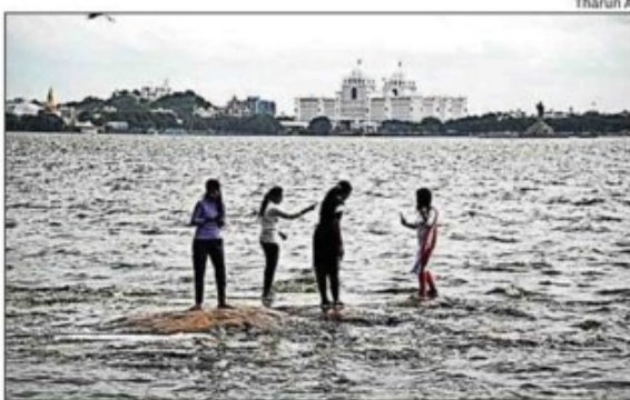
People venture into the waters of Hussainsagar to take selfies on Sunday

Incessant rains pounded the state for over a week, taking the dead toll to at least 32 in Telangana on Sunday evening. Rains and floods resulted in severe damages to crops, livestock, roads, bridges, culverts and other infrastructure. Hundreds of families were rendered homeless. The government shifted the people to safety and pressed NDRF teams for rescue and relief. In Moranchapalle village of Jayashankar Bhupalpally district, drones were used to retrieve bodies and efforts were on to search more