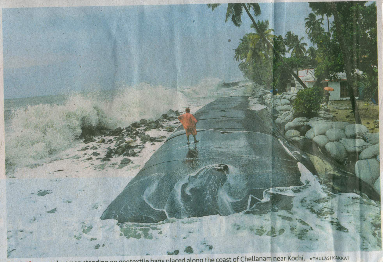
Protective gear: A person standing on geotextile bags placed along the coast of Chellanam near Kochi.

According to the Kerala State Disaster Management Authority 2,060 people (670 families) have been moved to 20 camps in the districts of Thiruvananthapuram (1), Alappuzha (2), Ernakulam (7), Thrissur (4), Palakkad (2), Malappuram (3) and Kozhikode (1). One death has been reported, while eight are missing in Thrissur.