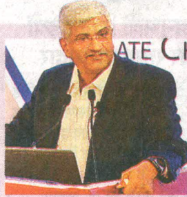
दिल्ली में आयोजित कार्यक्रम में केंद्रीय मंत्री गजेन्द्र सिंह शेखावत।

क्लाइमेट इंपैक्ट लैब की ओर से शिकागो यूनिवर्सिटी के टाटा सेंटर फॉर डेवलपमेंट के सहयोग से आयोजित कार्यक्रम में शेखावत ने जलवायु परिवर्तन के मुद्दे पर एक रिपोर्ट जारी की। उन्होंने कहा कि जलवायु परिवर्तन के दुष्परिणामों को