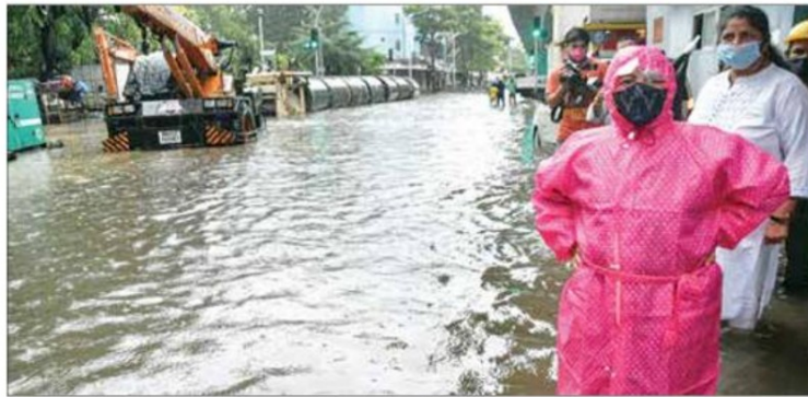
Mumbai Mayor Kishori Pednekar stands on a waterlogged road as she visited the Parel Hindmata area during heavy rain in Mumbai on Wednesday

While there were fewer vehicles on the city roads amid the downpour, motorcyclists and other two-wheeler riders were unable to manoeuvre their vehicles at some of the flooded places. The traf-