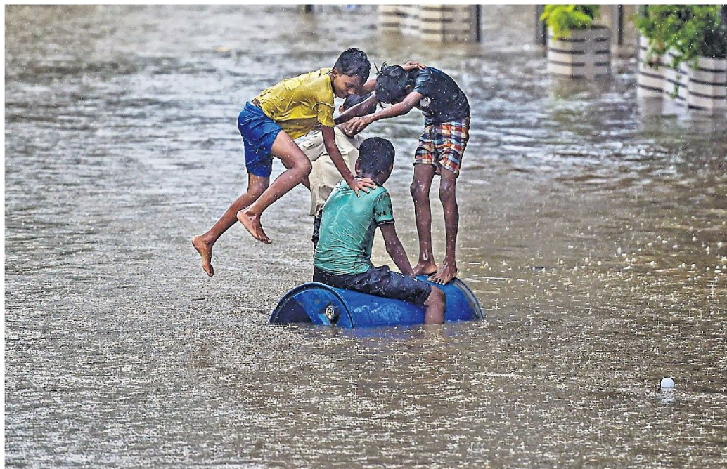
Children play on a flooded street in Mumbai on Wednesday.

Local train services from Mumbai's Chhatrapati Shivaji Maharaj Terminus (CSMT) to neighbouring Thane and Vashi in Navi Mumbai were suspended due to water-logging on some railway tracks, officials said. Routes of some BEST buses run the city civic body's transport wing were also diverted, they said. According to the IMD, the western suburb of Santacruz recorded 164.8 mm