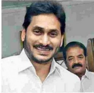
Y.S. Jagan Mohan Reddy

The Chief Minister may urge Amit Shah to help AP in getting required vaccine doses to inoculate the tar-