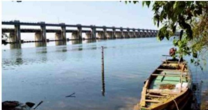
Commemorating 175 years: A file photo of Sir Arthur Cotton Barrage at Dowlaiswaram in East Godavari district.

The services of the department to the public, particularly in the rural areas,