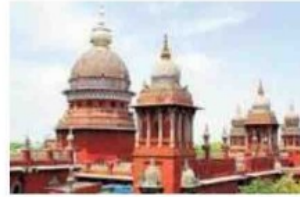
File counter affidavit within three weeks, says Madras High Court Bench.