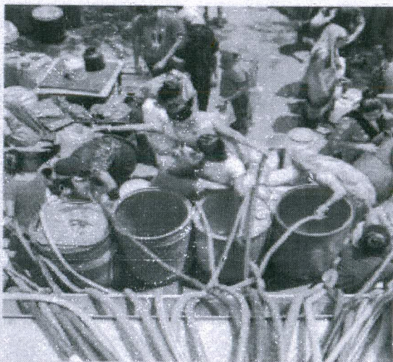
Bengaluru is using 100% of its underground water

SURPLUS rains in the Cauvery river basin in 2019 means residents of Bengaluru can heave a sigh of relief, as they have been assured their quota of water until next monsoon.