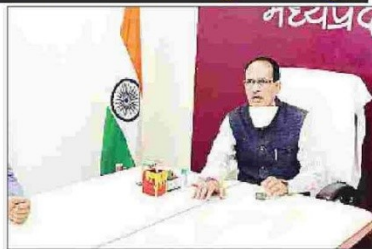
बैठक में अधिकारियों से चर्चा सीएम शिवराज सिंह।