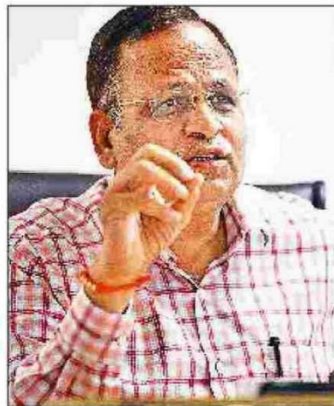
हरिभूमि न्यूज ► नई दिल्ली

दिल्ली के जल मंत्री सत्येंद्र जैन ने सोमवार को दिल्ली जल बोर्ड के वरिष्ठ अधिकारियों को परियोजना के अंतर्गत लंबित कार्यों को यथा शीघ्र पूरा करने के निर्देश दिए और कहा कि दृढ़ इच्छाशक्ति से ही असंभव कार्यों को संभव बनाया जा सकता है। जैन ने यह निर्देश दिल्ली में 24 घंटे जलापूर्ति परियोजना की कार्य प्रगति की समीक्षा बैठक में दिए। जैन ने कहा कि केजरीवाल सरकार कि दिल्ली निवासियों को 24 घंटे पानी की आपूर्ति करने की महत्वाकांक्षी जल आपूर्ति परियोजना के तहत पानी की मांग को पूरा करने के लिए दिल्ली में अद्वितीय जल निकासी कुओं का निर्माण करा रही है। दिल्ली सरकार, अपने वादों को हकीकत में बदलने की अपनी प्रतिबद्धता को पूरा करने के लिए इस परियोजना में तेजी लाने में कोई कसर नहीं छोड़ रही है। समीक्षा