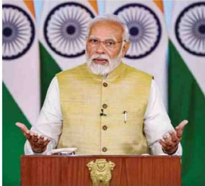
Prime Minister Narendra Modi delivers a video message at the launch of 'Jal-Jan Abhiyan' by Brahma Kumaris on Thursday.

"There shall be a tomorrow only if there is water, and for