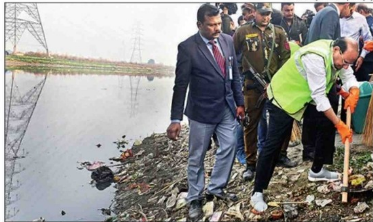
Qudsia Ghat is one of the most polluted stretches of the river in the city

He added that to remove the garbage floating in the river, a conveyor belt would be installed and an innovative technique used to reduce the biochemical oxygen demand (BOD) of the river. BOD is the sign of self-healing power of a river and