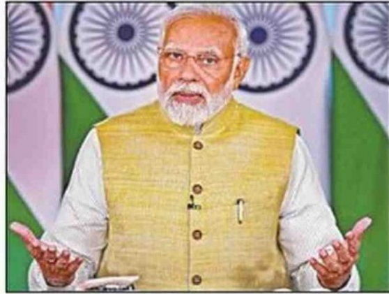
जल-जन अभियान की शुरुआत करते पीएम मोदी।

पीएम ने कहा, जल रहेगा तभी आने वाला कल भी रहेगा और इसके लिए हमें मिलकर आज से ही प्रयास करने होंगे। पीएम मोदी ने कहा, 'जल-जन अभियान' एक ऐसे समय में शुरू हो रहा है, जब पानी की कमी को पूरे विश्व में भविष्य के संकट के रूप में देखा जा रहा है। उन्होंने बृहस्पतिवार को राजस्थान के आबूरोड में ब्रह्माकुमारी संस्थान के 'जल जन अभियान' की शुरुआत को लेकर आयोजित कार्यक्रम को ऑनलाइन संबोधित करते हुए ये बातें कहीं।