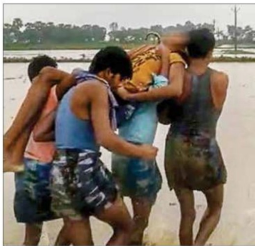
Villagers carry a man to a hospital after getting injured in a lightning strike, in Katihar district of Bihar, on Thursday

The flood situation in Assam, meanwhile, continued to remain grim as it claimed one more life on Thursday, taking the toll to 34, while over 16,03 people are affected in 22