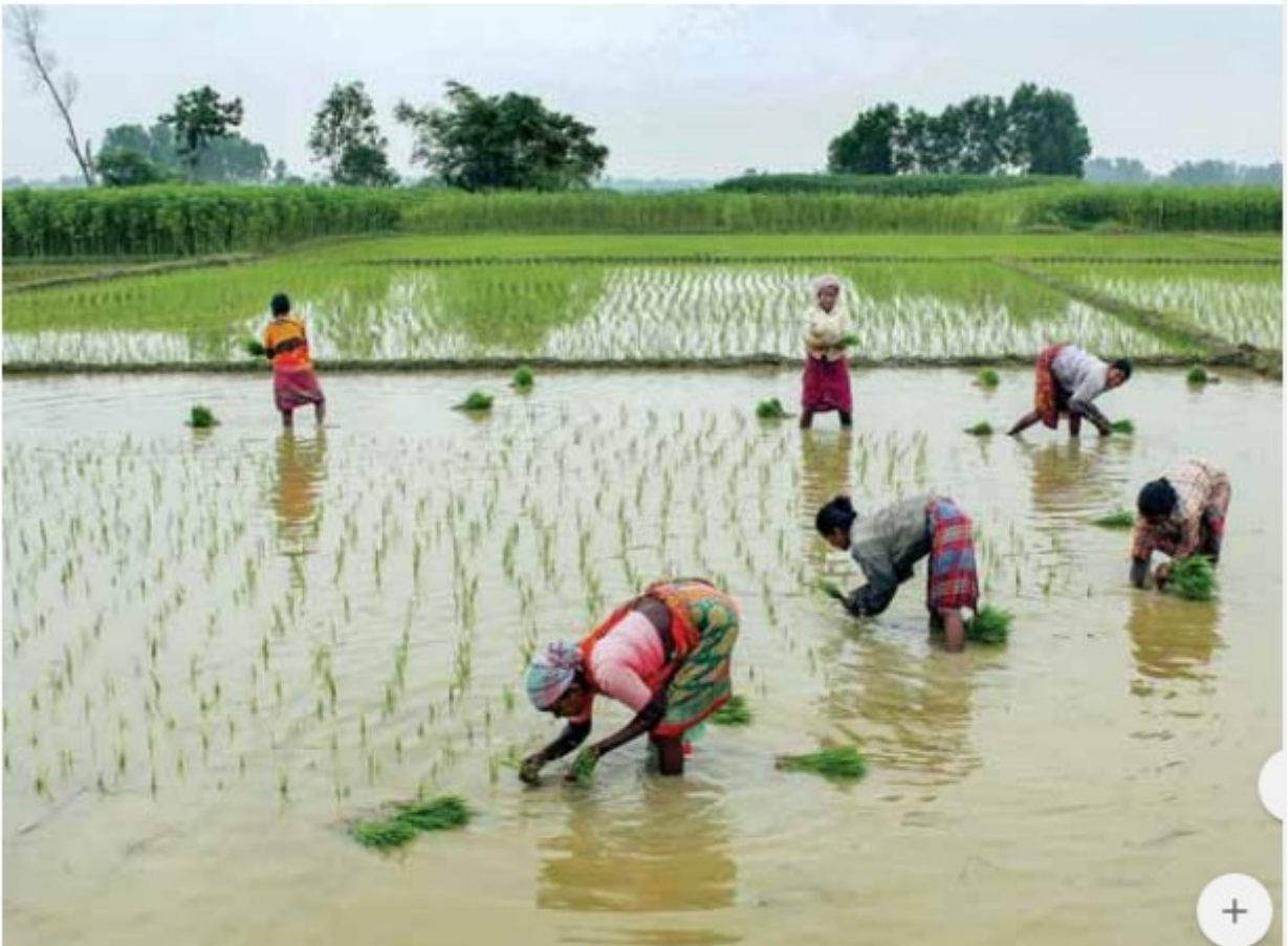
पश्चिम बंगाल के दक्षिण दिनाजपुर जिले में बालुरघाट के पास मानसून मौसम के दौरान एक खेत में धान के पौधे रोपते किसान

इलाकों में भारी से अत्यधिक भारी वर्षा होने का अनुमान है। मौसम विभाग के अनुसार, 24 घंटे में 64.5 मिलीमीटर से 115.5 मिलीमीटर के बीच हुई वर्षा को भारी और 115.5 मिलीमीटर से 204.5 मिलीमीटर के बीच हुई बारिश को अत्यधिक भारी वर्षा माना जाता है। मौसम विभाग के एक अन्य अधिकारी ने बताया कि शुक्रवार और शनिवार के लिए ऑरेंज अलर्ट जारी किया गया है। प्रशासन और लोगों से सतर्क रहने को कहा गया है। इस बीच मौसम विभाग की ओर से जारी अलर्ट के मद्देनजर मुंबई पुलिस ने लोगों से अनुरोध किया है कि वे घरों से बाहर ना निकलें। शहर पुलिस ने ट्वीट किया है, अत्यधिक बारिश का अलर्ट।