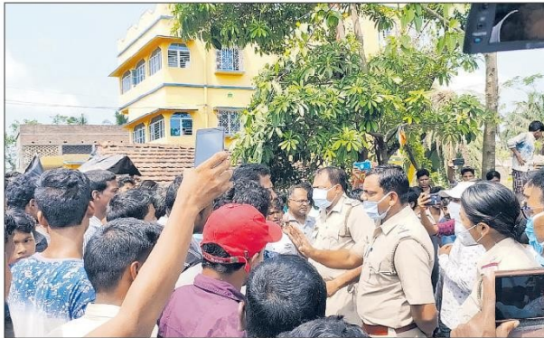
Villagers agitate against Amphan aid irregularities at Hazrakata in East Midnapore's Nandigram on Thursday.

In Nadia, bank accounts of about 100 panchayat functionaries of the ruling party, who received Amphan relief wrongfully, were temporarily frozen. A ruling party MLA said it was done to restore the image of the party. "Once leaders refund money, their accounts would be freed."