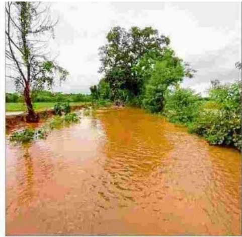
The Mundgod-Yellapur Road in Uttara Kannada district is under water.