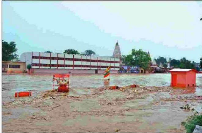
बारिश से हरिद्वार में गंगा खतरे के निशान से ऊपर बह रही है।