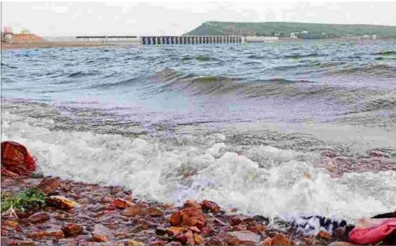
A view of the gushing backwaters of Almatti reservoir.