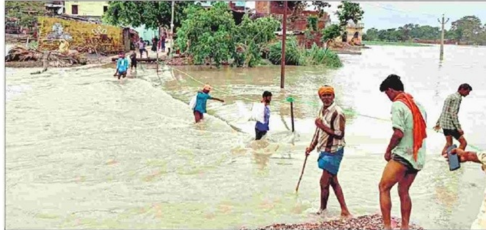
पूर्वी चंपारण के सुगौली नगर पंचायत के गोदाम टोला में शनिवार को रस्सी के सहारे घर से निकलते बाढ़ पीड़ित।

चंपारण में बाढ़ से कई प्रमुख सड़कों पर पांचवे दिन भी आवागमन ठप रहा। बाल्मीकि गंडक बैराज से 4 लाख 12 क्यूसेक पानी बड़ी गंडक नदी में छोड़ा गया। कुशीनगर के रेतक्षेत्र के गांवों में बाढ़ आ गई। नदी का पानी तुर्कहा मौनी नाला के रास्ते छितौनी बांध के इस पार बसे खड्डा ब्लॉक के बसडीला जंगल रंजिता, बगही टोला, शाहपुर नौकाटोला, नौतार जंगल में पहुंच गया।