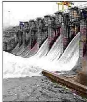
Water gushes out from Kadra reservoir in Karwar taluk.

tributaries flowing at ferocious speed, all nine low-lying bridge-cum-barrages have gone under water. Vast tracts of agriculture land in basin districts have gone under water.