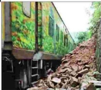
बारिश की चेतावनी दी है।

अलकनंदा में बढ़ते पानी से श्रीनगर गढ़वाल के निकट बदरीनाथ हाईवे पर धारी देवी मंदिर भी नदी के उफान में धिरता जा रहा है। उत्तरकाशी जिले के यमुनोत्री