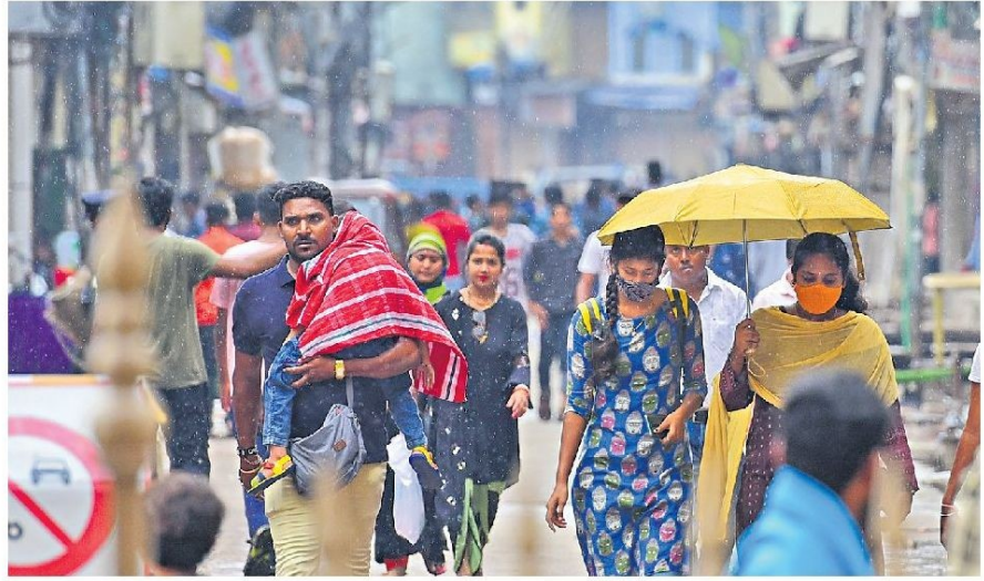
People make their way through drizzle in old city on Sunday.

The rains, however, failed to dampen the Ganesh idol immersion procession that across the city with devotees joining in large numbers braving the weather conditions. The maximum temperature of 30.8 degree Celsius was recorded today in the city, whereas the minimum was 26 degree Celsius. Many areas including Uppal, Malkajgiri, Charmi-