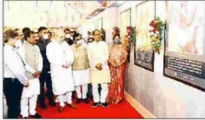
हरिभूमि न्यूज ॥ मोपाल

जबलपुर में गैरीसन ग्राउंड में आयोजित अमर शहीद शंकर शाह एवं कुंवर रघुनाथ शाह के बलिदान दिवस पर आयोजित कार्यक्रम को संबोधित करते हुए मुख्यमंत्री शिवराज सिंह चौहान ने कहा कि मप्र जैसे राज्य में जहां हैंडपंप से पानी भरते थे, आने वाले तीन साल में हर गांव में घर-घर पानी होगा। हर गांव में टंकियां बन रहें। तेजी से काम चल रहा है।