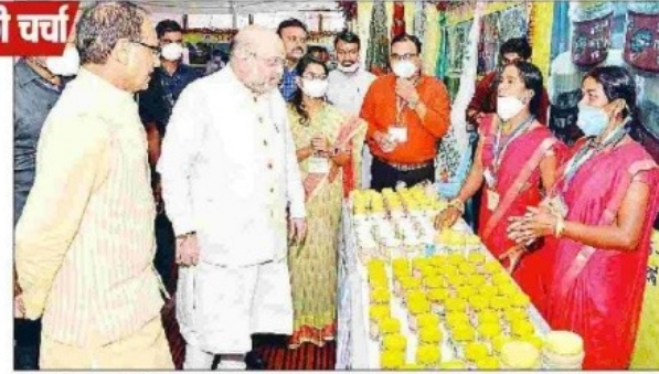
शाह और चौहान ने स्व-सहायता समूह के उत्पादों का अवलोकन कर सदस्यों से संवाद किया।

मुख्यमंत्री चौहान ने कहा कि प्रधानमंत्री नरेन्द्र मोदी द्वारा देश को नई शिक्षा नीति का तोहफा दिया है। जनजातीय बच्चों और युवाओं को प्रदेश में कक्षा आठवीं और नौवीं से ही भरे भांजा-भांजी को नोट, जेईई के फाउंडेशन को सुधारने, स्मार्ट क्लास की ऑनलाइन व्यवस्था की जाएगी। हम अपने पाठ्यक्रम को भी आज की आवश्यकताओं के अनुरूप बनाएंगे। साथ ही हमारे जनजातीय बेटा-बेटियों को फौज और पुलिस में चयन के लिए प्रशिक्षण की व्यवस्था भी प्रारंभ की जाएगी। इधर, जबलपुर में आचार्यश्री विद्यासागर महाराज से केन्द्रीय गृह एवं सहकारिता मंत्री अमित शाह और मुख्यमंत्री शिवराज सिंह चौहान ने मेट कर आशीर्वाद लिया।