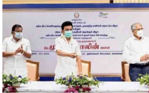
Chief Minister M.K. Stalin inaugurating various infrastructure projects at a virtual event on Thursday.

Mr. Stalin said a Sipcot Industrial Park would be established in Dharmapuri, and additional buildings would be constructed adjacent to the Dharmapuri Collectorate