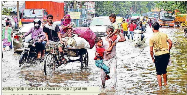
जहंगीरपुरी इलाके में बारिश के बाद जलभराव वाली सड़क से गुजरते लोग।

शुक्रवार देर रात से शनिवार सुबह तक हुई जबरदस्त बारिश ने दिल्ली के गत 13 सालों बाद नया रिकॉर्ड दर्ज किया है। भारत मौसम विभाग (आईएमडी) ने बताया कि दिल्ली