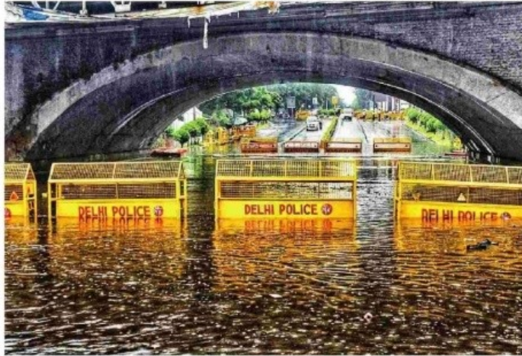
45 मिनट तक पानी निकासी और कीचड़ की सफाई करने के बाद मिंटो ब्रिज को ट्रैफिक के लिए खोला जा सका।

जखीरा अंडरपास : जखीरा अंडरपास भी पूरी तरह से जलमग्न हो