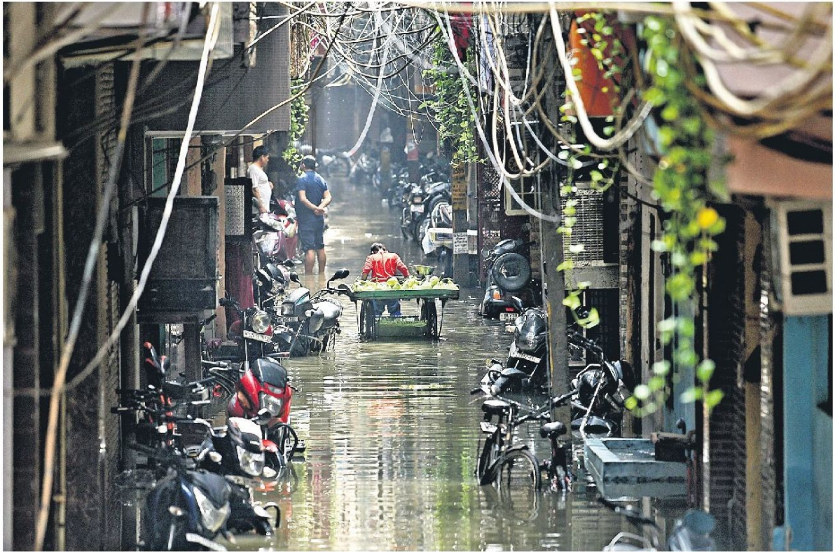
A vegetable vendor pulls a cart through a waterlogged street after heavy rainfall, at Vinod Nagar, in New Delhi on Saturday.