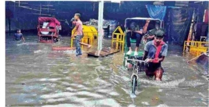
Heavy waterlogging near Shahdara railway station; tree uprooted in Jahangirpuri during the downpour.

Traffic movement was also disrupted on the Mehrauli-Badarpur road in south Delhi. People were also seen