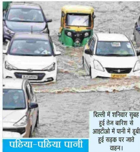
दिल्ली में शनिवार सुबह हुई तेज बारिश से आइटीओ में पानी में डूबी हुई सड़क पर जाते वाहन।

राजधानी में 24 घंटे में 138.8 मिलीमीटर बारिश दर्ज की गई। जलभराव के कारण कई जगहों पर जाम। रविवार को आसमान में बादल छाए रहेंगे और हल्की बारिश हो सकती है। अब तक दिल्ली में अगस्त महीने के दौरान एक दिन में सबसे अधिक बारिश होने का रिकॉर्ड 184 मिमी है जो दो अगस्त 1961 को दर्ज की गई थी।