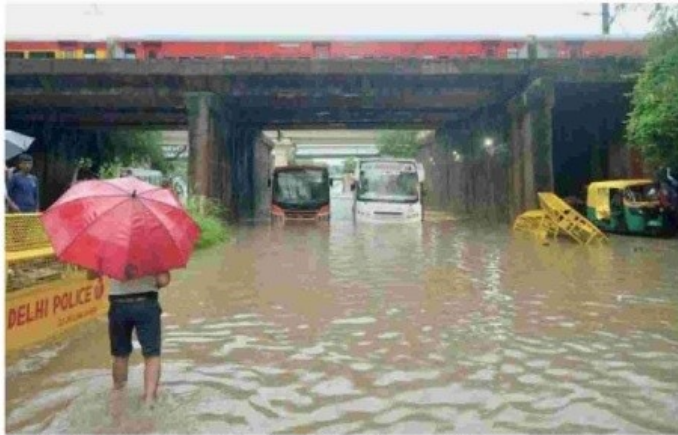
Familiar sights: Two buses stalled under a railway bridge near Welcome metro station in north-east Delhi; (below) vehicles stuck in the water at Azadpur underpass in north Delhi following heavy rain on Saturday. • R.V. MOORTHY, SUSHIL KUMAR VERMA

The IMD had issued an 'orange' alert for Saturday, a warning for extremely bad weather with the potential of disruption in commute with road and drain closures and interruption of power supply. A 'yellow' warning has been issued for Sunday, indicating severely bad weather.