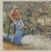
पाइप का वाल्व खोलते युवक

बांध पर पंप हाउस बना है। पंप हाउस से पानी को लिफ्ट करके ऊंचाई पर बनी टंकी तक पहुंचाया जाता है। टंकी से पाइप के माध्यम से 300-300 हेक्टेयर के चक (खेतों के समूह) तक पानी पहुंचता है। फिर 20-20 हेक्टेयर के चक तक पानी पहुंचाया जाता है। इसके बाद खेतों के अंदर पाइपलाइन का जाल बिछाकर पांव-पांव हेक्टेयर तक के छोटे चक तक पानी पहुंचाते हैं। यहां से एक हेक्टेयर कृषि क्षेत्र तक भी पाइप से ही पानी पहुंचता है। यहां वाल्व लगे हैं, जिसे किसान आवश्यकतानुसार खोलकर सिंचाई के लिए पानी ले सकते हैं। पूरी प्रणाली की निगरानी सुपरवाइजर की कंट्रोल रूम डाटा एक्विजिशन सिस्टम (स्कड) से की जाती है।