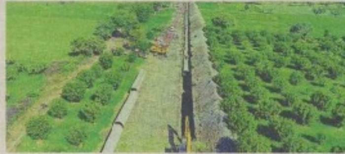
मद्र के राजगड जिले में जारी भूमिगत पाइप सिंचाई प्रणाली का कार्य • तो, जोहवापुर सिंचाई परियोजना

मद्र का मोहनपुरा यह नवाचार करने वाला देश का पहला बांध, भूजल संकट के बीच जल संरक्षण को मिला संवत