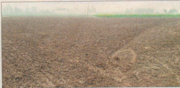
The floods delayed paddy resowing and further hampered wheat sowing.