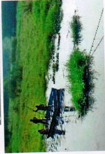
प्रयागराज : मैकफर्सन लेक में जमी जंगली घास को बोट और काटे की मदद से बाहर निकालते सेना के जवान • जागरण

मैकफर्सन लेक के नाम से मशहूर रही यह झील शहर के पश्चिमी छोर पर गंगा किनारे करीब दो किमी लंबे दायरे तक जाती है। इसमें शहर के कुछ हिस्से का सीवेज भी गिरता है। यह सीवेज तीन किमी अधिक लंबे कच्चे नाले से होकर गंगा में गिरता था। करीब डेढ़ दशक पहले तक लेक का हिस्सा नेहरू पार्क में था। उसी