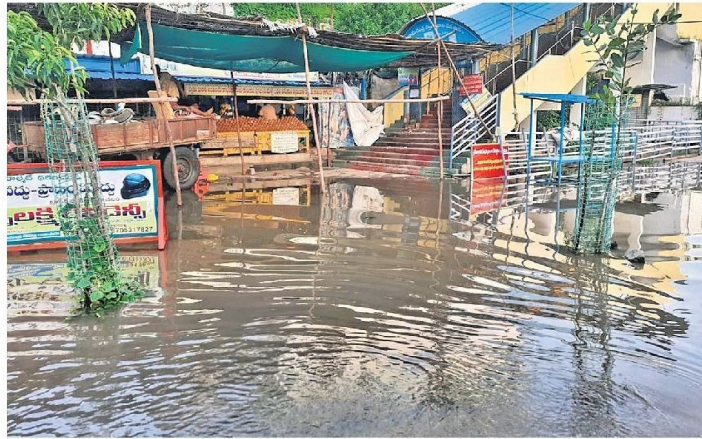
Bhadradi temple surroundings flooded in Kothagudem district on Saturday.

Anudeep informed that as many as 27 pregnant women in flood-affected areas in