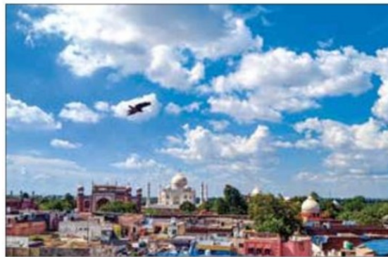
A view of clouds hover over the Taj Mahal in Agra, on Saturday

In Punjab and Haryana, the maximum temperatures stayed