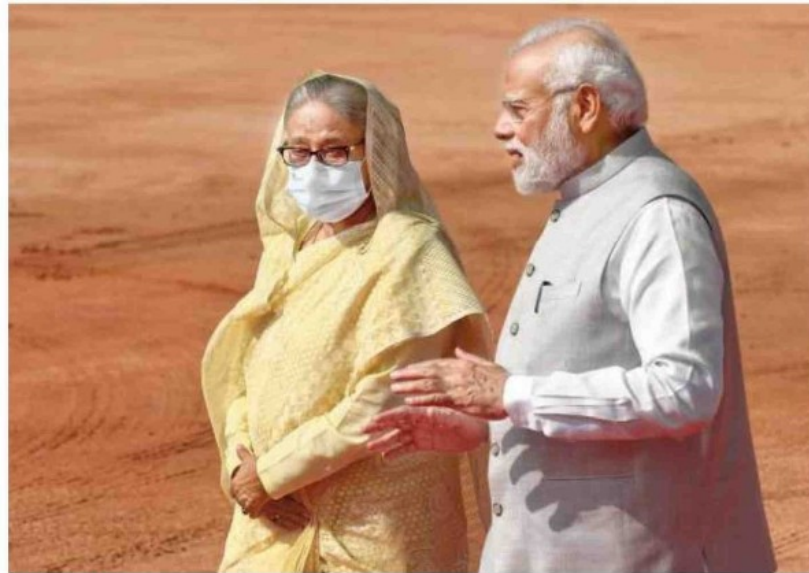
Common ground: Bangladesh Prime Minister Sheikh Hasina with Prime Minister Narendra Modi for the ceremonial reception at the Rashtrapati Bhavan on Tuesday. ■V.V. KRISHNAN

The two sides, however, made a significant beginning in river-water sharing by reaching an agreement – a first in 28 years – on drawing water from the common border river Kushiyara for supplying to parts of lower