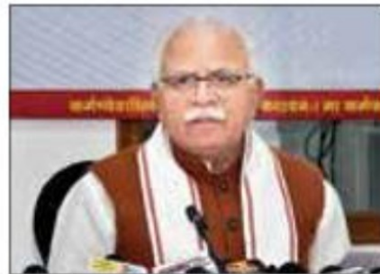
Manohar Lal Khattar

Meanwhile, Khattar has again clarified that the people of the state have the right over SYL waters and they are