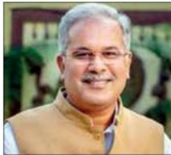
CM Bhupesh Baghel

At the initial phase, 07 sites have been selected by Generation Company for the establishment of the hydropower projects of about 10 thousand MW capacity. Among the selected sites, a study will be conducted to establish the project in Korba, Jashpur, Surguja, Gariaband, Dhamtari and Bal-