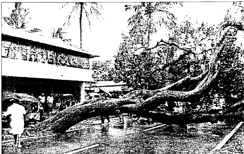
■ An uprooted tree blocks a road in Kerala and (below) People take cover during heavy downpour in Chennai on Thursday.