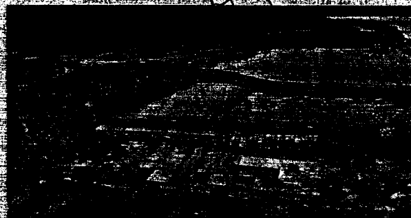
In limbo: A file picture of the Polavaram site in West Godavari district.

Mr. Naidu said he was hopeful that all issues would be resolved amicably. He would be meeting the Prime Minister soon to inform him of the status of the various commitments given under