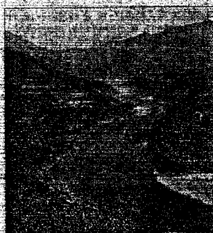
चीन पर दबाव बनाए

ब्रह्मपुत्र की मुख्य धारा और अरुणाचल प्रदेश की लाइफलाइन समझी जाने वाली सियांग नदी का पानी काला हो जाने से समूचे नॉर्थ-ईस्ट में चिंता बढ़ गई है। पिछले दो महीनों से इस नदी के पानी में मिट्टी, रेत और थोड़ी सीमेंट भी देखने को मिल रही है। इससे आश्चर्य से देख रहे हैं लेकिन मछलियों के लिए यह जानलेवा साबित हो रहा है। इस पर्यावरणीय आपदा को एक कूटनीतिक संकट के रूप में भी देखा जा रहा है। माना जा