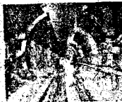
A view of the Kishenganga project

• A 'Court of Arbitration' was set up due to Pakistan's objection to the project