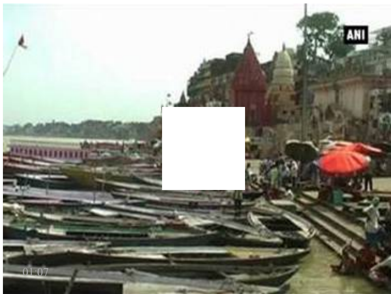
Authorities prohibit boating in Varanasi as Ganga swell

L UCKNOW: Next time someone throws waste in Ganga, Armymen might warn them against doing so. Adding to it, they would also be seen making people aware about the demerits of polluting the holy river and carrying out plantation. A battalion of the Indian Army has been hired for the purpose for a period of five years. Three more battalions would be added later.