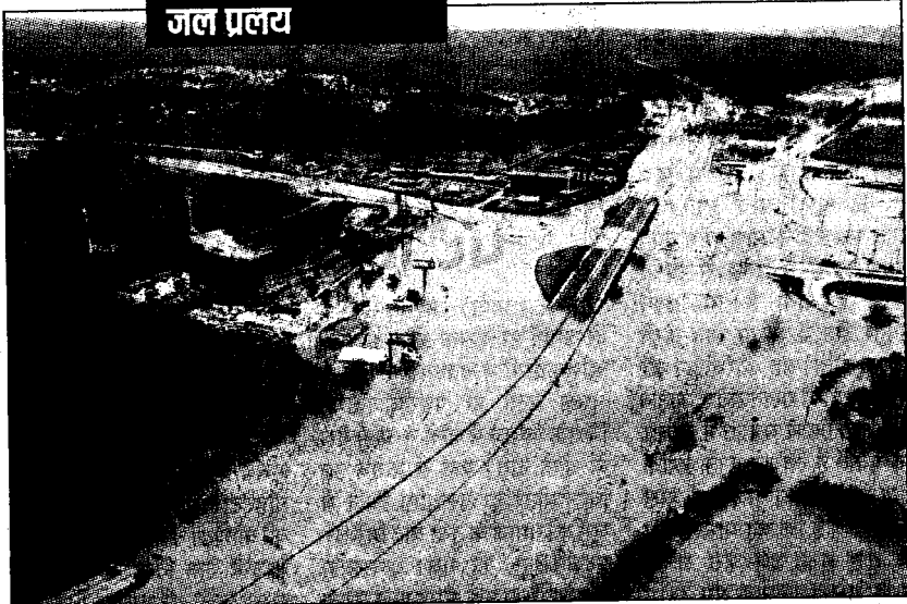
अमरीका की नदियों में उफान आने के कारण मध्य पश्चिम इलाके में जलमग्न वैली पार्क का एक दृश्य।