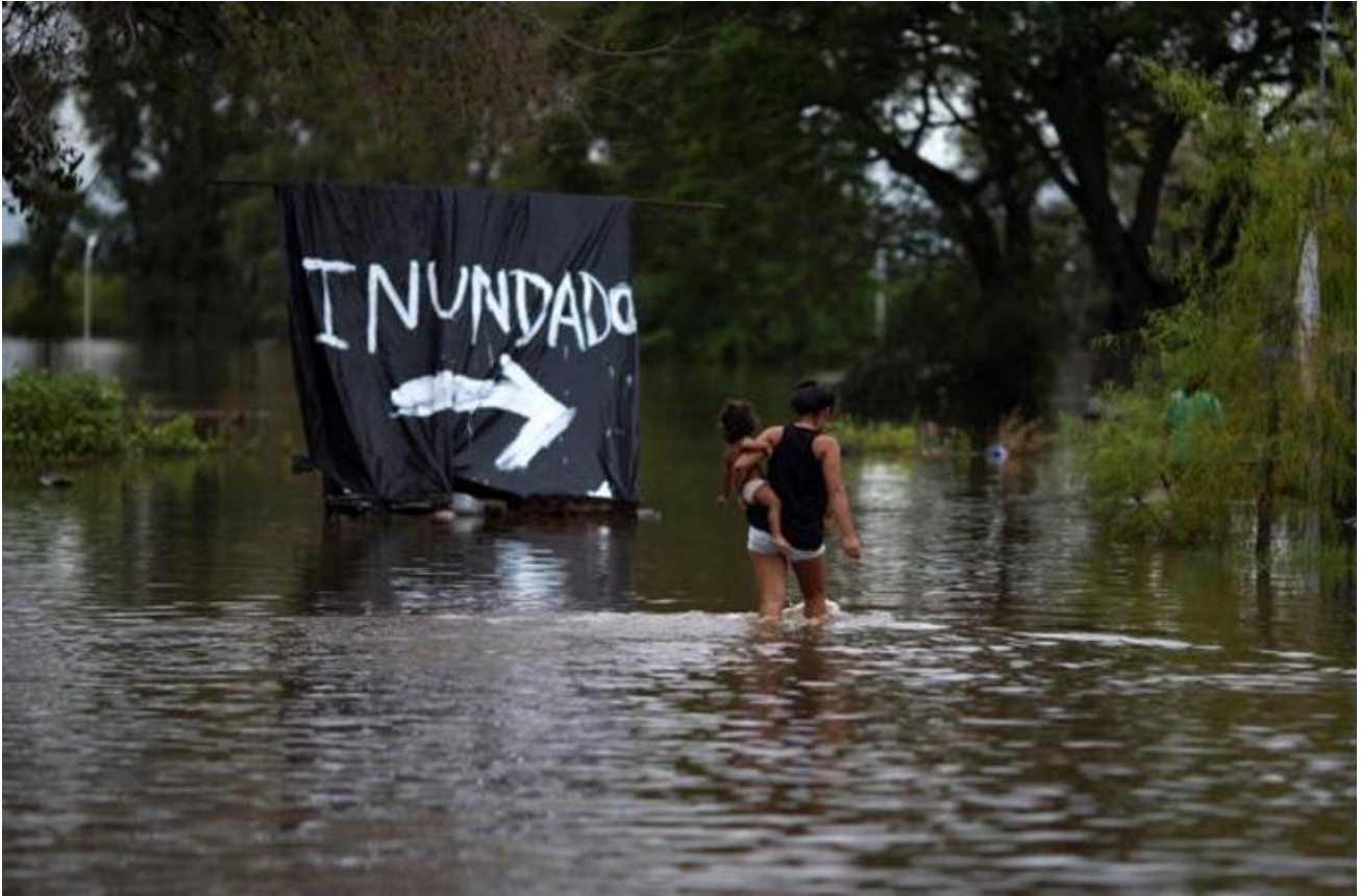
A woman carries her baby through a flooded area of Concordia, Entre Rios province, Argentina, on December 29, 2015. Over recent days the storms blamed on El Nino have killed people in Brazil and in Argentina. Officials say rainfall has driven at least 160,000 people from their homes in Paraguay, Argentina and Uruguay.

deadly heat waves in Australia, devastating forest fires in Indonesia and flooding in Peru and California, killing 23,000 people worldwide.