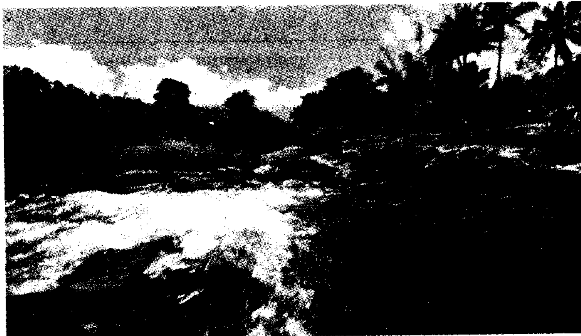
Chief Minister Jayalithaa had said the State did not receive the letters supposed to have been written by the Kerala government on construction of the dam.

An official release from the Tamil Nadu government issued on Wednesday quoted a communication from the Centre conveying its de-