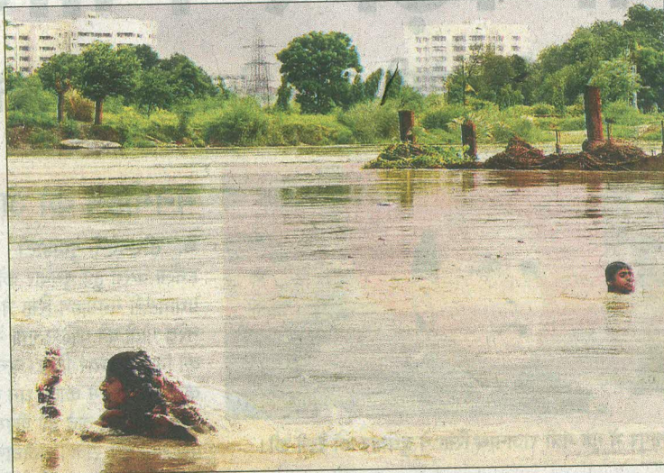
पानी लेने के ही नहीं, पानी बढ़ाने के भी करें उपाय

लगातार बढ़ते प्रदूषण, पानी के अत्यधिक दोहन, सहायक नदियों के सूखने, बड़े बांधों के निर्माण और जलवायु परिवर्तन से नदियों के लुप्त होने का खतरा पैदा हो गया है। नदियां हमारे लिए सिर्फ पानी का स्रोत नहीं, सभ्यता-संस्कृति और जीवन मूल्यों का प्रतीक भी हैं। अपना जीवन संवारते हुए हमने नदियों की जिंदगी छीन ली है। गंगा-यमुना और इसकी सहायक नदियों से पानी के अंधाधुंध दोहन ने इनकी हालत बिगाड़ दी है। देश में गंगा की सभी सहायक नदियों का पानी बांधों द्वारा नियंत्रित है, जो 60 फीसदी प्रवाह को सिंचाई के लिए मोड़ देते हैं। वैज्ञानिकों