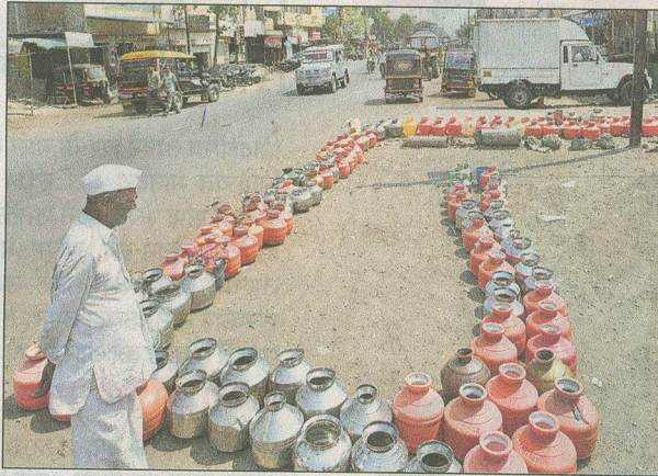
■ Ten states are battling drought. In Maharashtra, the crisis has affected 70% of the state and led to water riots and rationing.