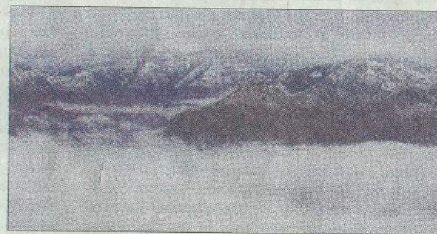
A picturesque view of the snow-clad Dhauladhar range.

Rampur-bound buses were diverted through Basantpur and Kingal as the national highway was blocked at Fagu, Kufri and Narkanda. The Shimla-