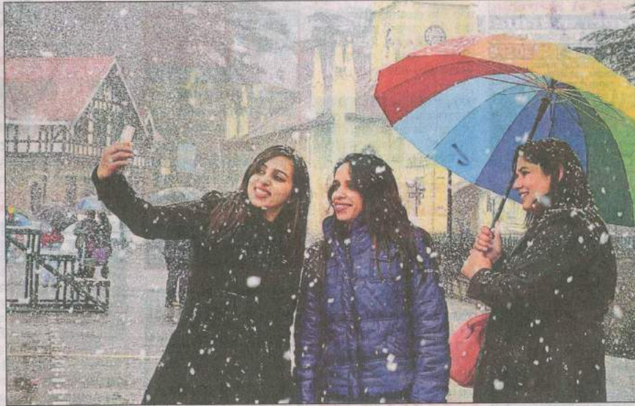
शिमला में रविवार को बर्फबारी के बीच सेल्फी लेती लड़कियां। • प्रेर

हिमाचल प्रदेश में शिमला और उसके आसपास के क्षेत्रों में मौसम का पहला हिमपात देखा गया। अन्य आदिवासी क्षेत्रों एवं पर्वतीय इलाकों में भी सवेरे से भारी बर्फबारी की खबरें हैं। शिमला में 18 सेंटीमीटर हिमपात दर्ज किया गया जबकि कुफरी, फागू, नरकंडा, खारपथर चोपाल, हरिपुरधार और नौरधार में 20 से 35 सेंटीमीटर हिमपात दर्ज किया गया। जम्मू-कश्मीर के श्रीनगर-जम्मू राष्ट्रीय राजमार्ग समेत कुछ इलाकों में हल्की बर्फबारी और बारिश दर्ज की गई। उन्होंने बताया कि जवाहर सुरंग और पटनीचैप के पास ताजा हल्की बारिश और बर्फबारी दर्ज की गई है। ऊंचाई वाले कुछ अन्य क्षेत्रों में भी बर्फ गिरने की खबर है जैसे कि भदरवाह में दो सेंटीमीटर हिमपात दर्ज किया गया।