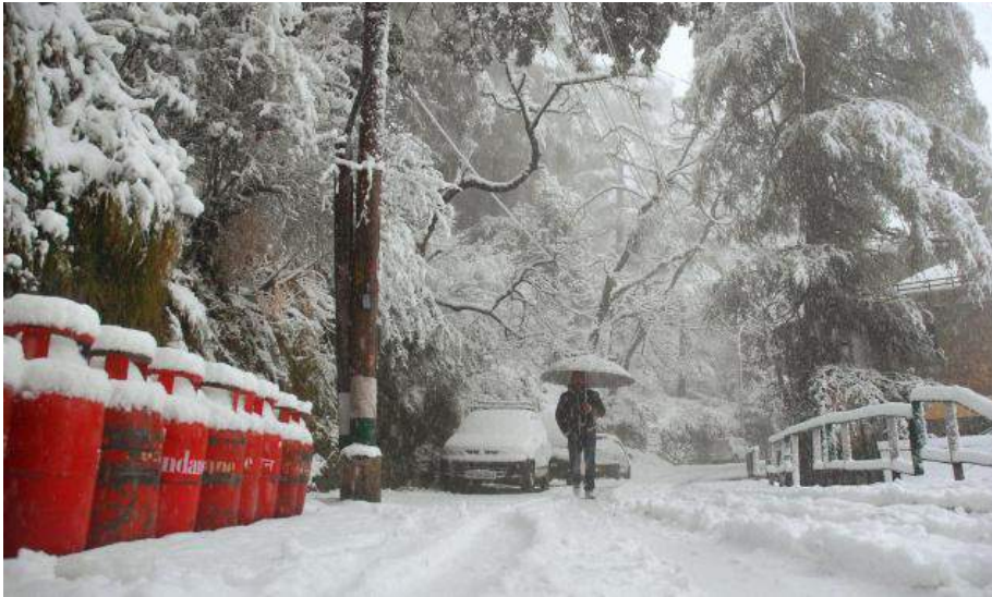
A scene from snow-covered Shimla on Sunday.

The Capital city and its nearby tourist resorts received a good spell of snow on Sunday after a long dry season, bringing cheers to locals and tourists.