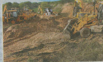
Farmers working on a part of the Sutlej-Yamuna link canal in Patiala district of Punjab.