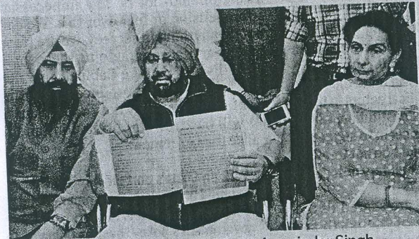
SHOCK: Punjab Congress chief Capt. Amarinder Singh announces his resignation from the Amritsar Lok Sabha seat in Chandigarh on Thursday.

The AAP accused both the Congress and the Shiromani Akali Dal as being responsible for the adverse court opinion. It said it would stage an indefinite protest at Kapoor village (origin of SYL Canal) from November 11.