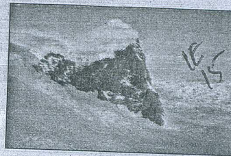
A rock outcropping on Fleming Glacier, which feeds one of the accelerating glaciers in Marguerite Bay on the western Antarctic Peninsula.

In a summary of the research in the non-profit online environment magazine Grist , the meteorologist Eric Holthaus wrote the