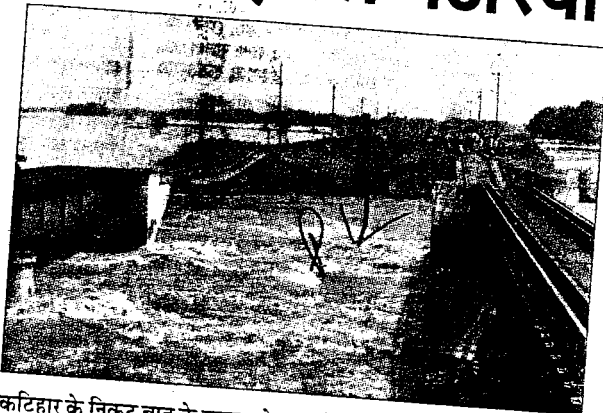
कटिहार के निकट बाढ़ के कटाव से ध्वस्त रेलवे ट्रैक।

नेपाल में हो रही बारिश से बिहार की सभी प्रमुख नदियों के खतरे के निशान से ऊपर रहने के कारण राज्य के 13 जिलों में बाढ़ की स्थिति बंकाव हो गयी है और इससे अब तक 85 लोगों की मौत हो चुकी है, प्रभावित करीब 80 लाख लोगों को युद्धस्तर पर राहत एवं बचाव के लिए सेना के अलावा तीन