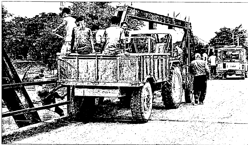
जोगबनी में मीरगंज पुल से मंगलवार को परमान नदी में ट्रैक्टर से शव (लाल घरे में) फेंकते लोग।