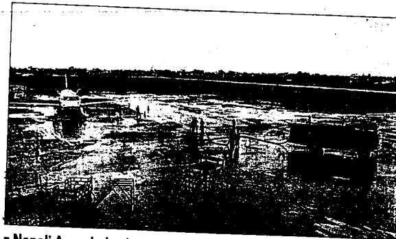
• Nepali Army help clean mud left from floods in Kathmandu.

Officials at Chitwan National Park, famous as the habitat of the Royal Bengal Tiger, one-horned rhinos and elephants, are preparing to bring back the animals swept away to different places within Nepal and to India.