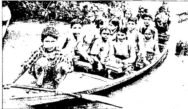
मार्सूमी का जज्बा: गोण्डा जिले के नवाबगंज क्षेत्र में बाढ़ के बीच नाव में सवार होकर सोमवार को स्कूल जाते बच्चे।

बिहार के चौदह-भागलपुर, कटिहार, सुपौल, पूर्णिया, मधेपुरा, सहरसा, मधुबनी, दरभंगा, सीतामढ़ी, मुजफ्फरपुर, शिवहर, पूर्वी चंपारण, पश्चिमी चंपारण, गोपालगंज और यूपी के गोरखपुर, कुशीनगर, देवरिया, सिद्धार्थनगर, महाराजगंज आदि की स्थिति खराब है। कई जगह तटबंधों के टूटने से एक करोड़ से अधिक आबादी फंसी हुई है। इनके बचाने की सेना की मदद ली जा