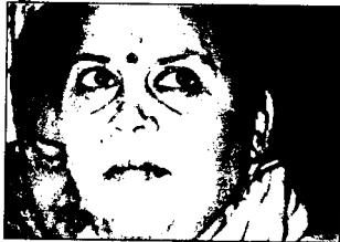
केंद्रीय मंत्री उमा भारती।

दिल्ली में बांध पुनर्वास एवं सुधार परियोजना (डीआरआईपी) से प्राप्त सबक पर आयोजित राष्ट्रीय कार्यशाला का उद्घाटन करते हुए उमा ने कहा, बड़े बांधों में एकत्र किए गए पानी का समुचित उपयोग नहीं किया जा रहा है।