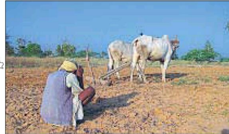
■ Prime Minister Narendra Modi's new scheme assures relief to farmers who can't grow any crop due to drought.

The last year has seen one of the worst droughts in recent past and unusual rains, leading to distress among farmers