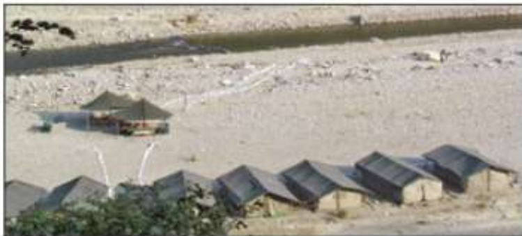
A few days after a TOI report, the Uttarakhand government, through an official of the rank of additional chief secretary, had submitted before the green tribunal that no such camps had been set up

For the full report, log on to http://www.timesofindia.com