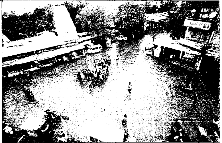
अहमदाबाद में मंगलवार को भारी वर्षा के बाद शहर में कई जगह पानी भर गया।

कोंकण क्षेत्र में पिछले चार दिनों से अच्छी बारिश हुई है इसकी तुलना में महाराष्ट्र के मध्य भाग में वर्षा अभी कम हुई है। पिछले 24 घंटे में मुंबई के पडोसी क्षेत्र अलीबाग में 173 मिलीमीटर बारिश दर्ज की गई है, तो वहीं भीर में 169 मिलीमीटर बारिश दर्ज की गई है। दूसरी ओर गुजरात के दक्षिणी शहर वलसाड में पिछले 24 घंटों के दौरान हुई भारी वर्षा के कारण रेल पट्टी पर पानी भर जाने के कारण कम से कम से पांच रेलगाड़ियों को रद्द कर दिया गया है जबकि सूरत-मुंबई रेल खंड पर कई ट्रेनें विलंब से चल रही हैं। उधर शहर में छीपवाड.