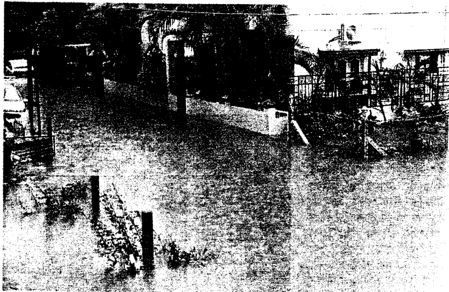
गुजरात के वलसाड में भारी बारिश के बाद रिहायशी इलाके में भरा पानी।

नई दिल्ली. गुजरात, ओडिशा, आंध्रप्रदेश, महाराष्ट्र, असम, हिमाचल, उत्तराखंड, दिल्ली, केरल और उत्तर प्रदेश में लगातार बारिश से कई इलाकों में बाढ़ जैसे हालात हैं। वहीं पिछले 24 घंटों में देशभर में बारिश जनित हादसों में 8 की मौत हो गई। गुजरात के कांडला, वलसाड व राजकोट में बाढ़ से हालात बिगड़ने लगे हैं। कांडला में 9 घंटे में 8 इंच और वलसाड में 20 घंटे में 12 इंच बारिश हुई। वलसाड की औरंगा और वाको नदी पर बने पुलों पर यातायात बंद कर दिया गया है। नदियां इन पुलों के ऊपर से बह रही हैं। स्कूल और कॉलेज में छुट्टियां घोषित कर दी गई हैं। गुजरात के अन्य जिलों अमरेली, भावनगर और राजकोट में भी भारी बारिश से बाढ़ के हालात बन गए हैं। वहीं यूपी में गंगा और घाघरा समेत कई बड़ी नदियां खतरे के निशान के आसपास बह रही हैं। मौसम विभाग ने आने वाले 24 घंटे में महाराष्ट्र, आंध्र, हिमाचल और उत्तराखंड में भारी बारिश का अलर्ट जारी किया है।