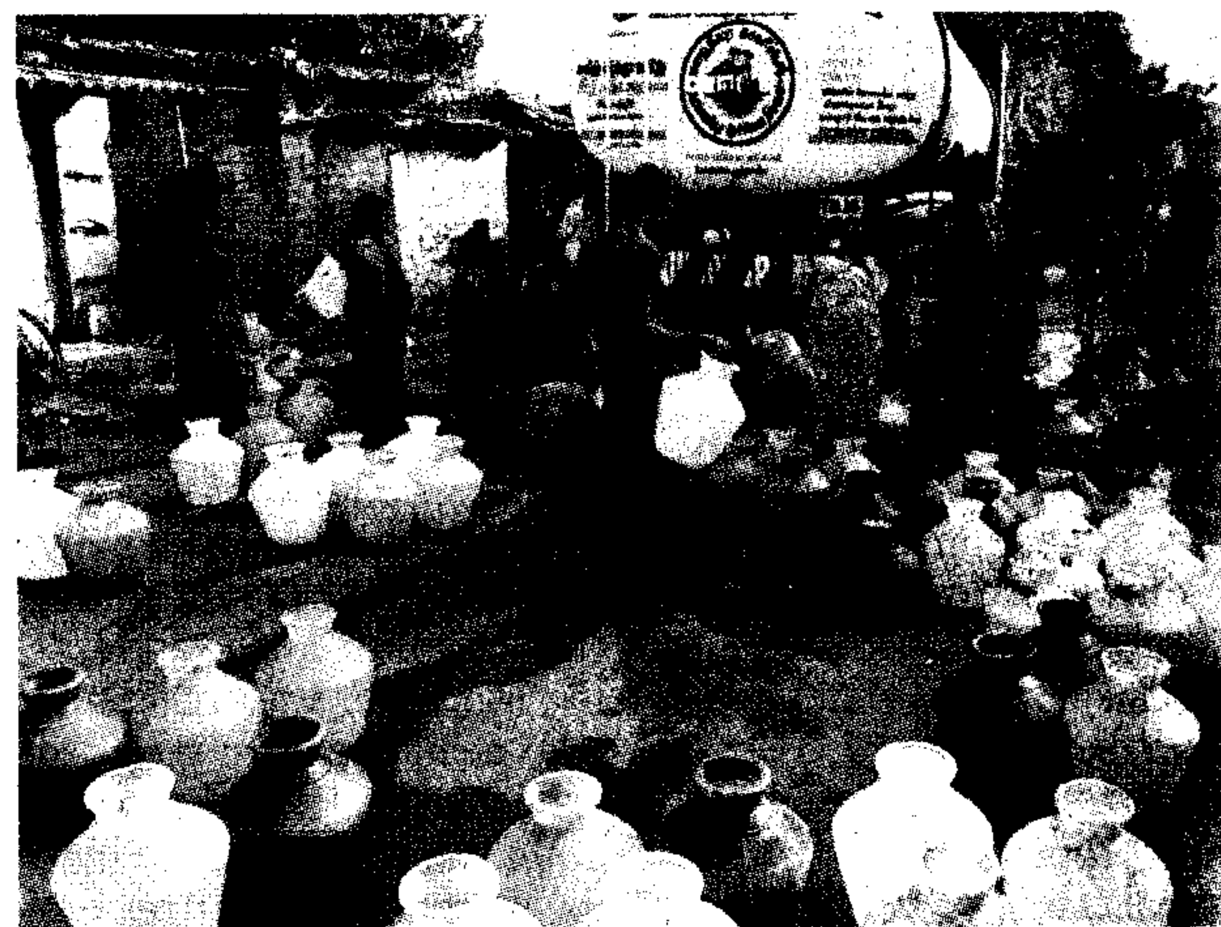
Krishna water and the Veeranam tank may help tide over any water crisis in the city. Supply to parts like Greames Road remains the same so far.

Another ray of hope is the steady increase in the storage of Veeranam tank in Cuddalore district, which augments the water supply to the city.