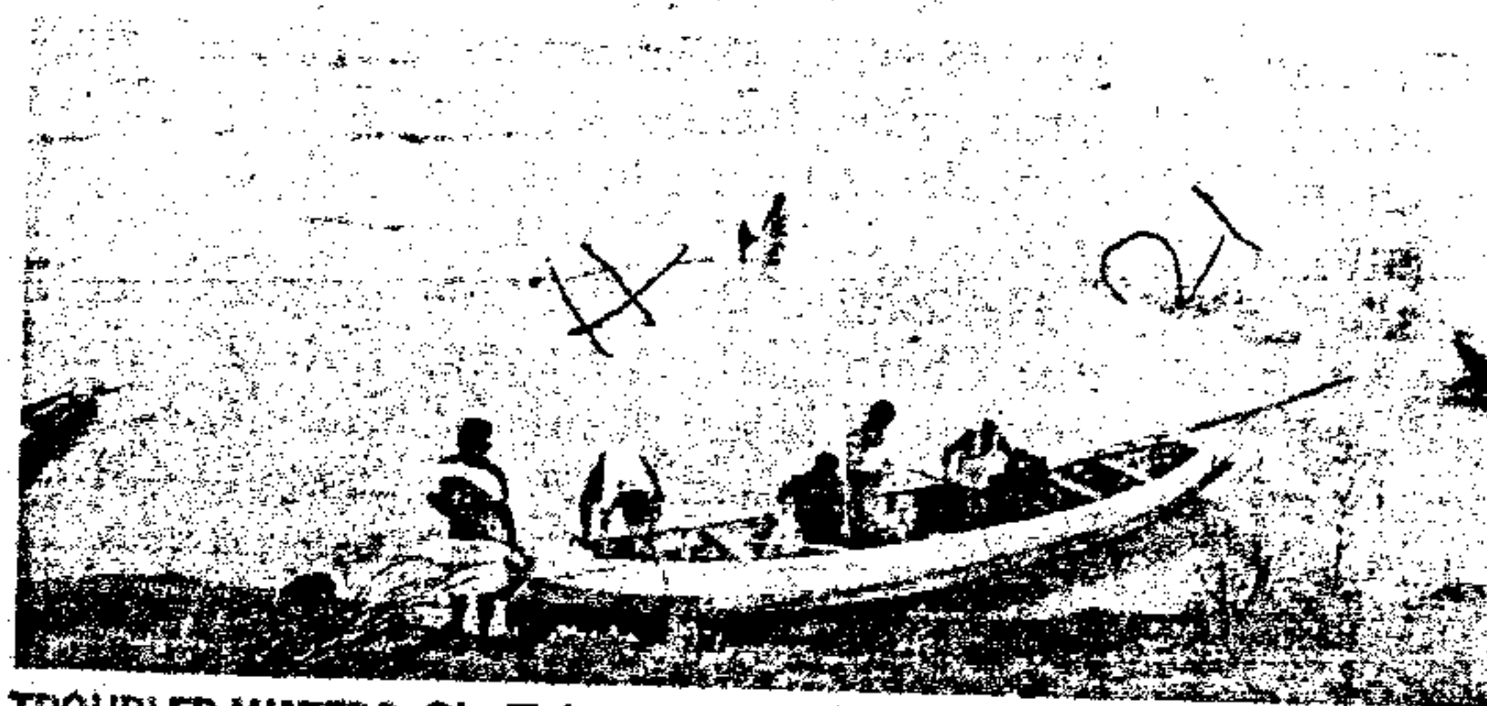
TRoubled WATERS: Six Telangana projects are among those the board will manage.

In the working manual draft, sent to Telangana and Andhra Pradesh recently, the GRMB authorities are understood to have included half a dozen projects of Telangana against only one of A.P. in the list of projects it proposes to manage. Apart from monitoring the water releases (regulation) from