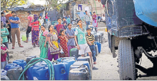
नई दिल्ली में रविवार को टैंकर से पानी लेने का इंतजार करते लोग।