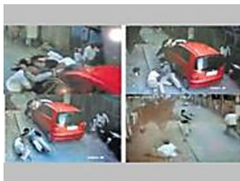
Residents recount how Tuesday turned tragic