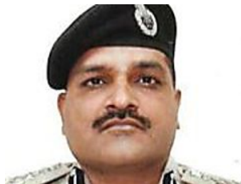
'Give me eight months and I can rout out corruption from the Delhi govt'