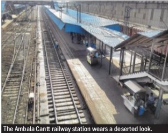
The Ambala Cantt railway station wears a deserted look.

Sonepat: The canal water supply to Delhi through the Delhi branch of West Yamuna Canal and Delhi Parallel Carrier Channel was on Saturday stopped by Jat protesters. Both channels are having a water-carrying capacity of 1,085 cusecs, which is released by removing the iron control panels installed near Garhi Bindroli village in the district. The protesters had even rooted out parts of iron control panels. According to Irrigation Department officials, the stoppage of supply will create drinking water crisis in many areas of Delhi. oc