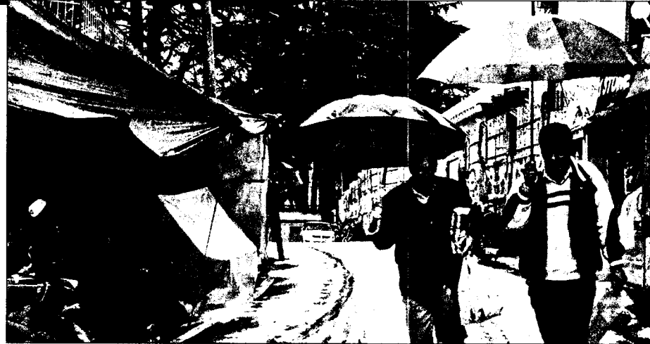
मसूरी में शनिवार को बारिश के बीच खरीदारी करने के लिए जाते लोग।

मसूरी। पहाड़ों की रानी मसूरी में एक बार फिर से मौसम ने करवट बदली जिससे सुबह के समय काले बादलों के साथ ही तेज बारिश और ओलावृष्टि होने से तापमान में भारी गिरावट दर्ज की गई। बारिश होने से जहां स्थानीय लोगो को काफी दिक्कतों का सामना करना पड़ा वहीं देश विदेश से आए पर्यटकों ने मौसम का जमकर लुत्फ उठाया। वहीं सड़क में जमे ओलों से दुपहिया वाहन चालकों को वाहन चलाने में काफी मुसीबतों का सामना करना पड़ा। सुबह के समय बारिश और दोपहर में फिर धूप खिल गई और शाम 5 बजे जमकर ओलावृष्टि हुई।