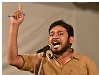
Multiple videos of Kanhaiya Kumar raising incendiary slogans unspool a mystery