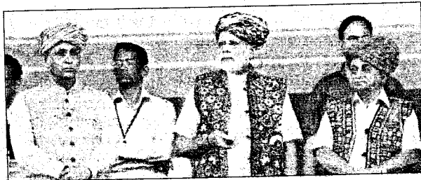
PM Modi, CM Rupani at the inauguration of a pumping station on Kutch Branch canal, in Kutch district on Monday.

coming functional, Sardar Sarovar Narmada Nigam Limited will start releasing water into the Tappar dam near Bhuj soon, Modi said.