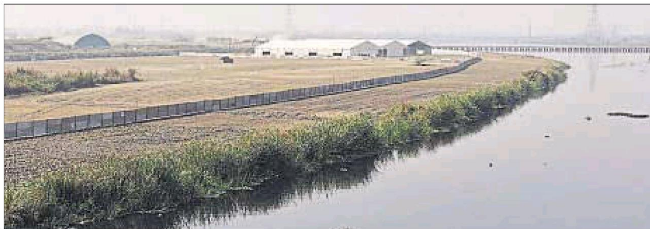
■ An area of 1,000 acres have been cleared to construct huts, pandals and a giant 7-acre stage right on the river channel.

CULTURAL EVENT National Green Tribunal may decide the fate of the Art of Living event today