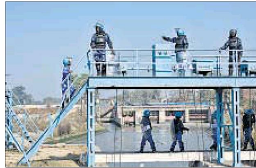
■ Paramilitary personnel deployed at Munak Canal, a major water source for Delhi, in Haryana.

Out of the 900 million gallons of water that the Delhi Jal Board distributes every day, 540 million gallons come from Haryana. Any trouble in the neighbouring state can, and does, spell trouble for