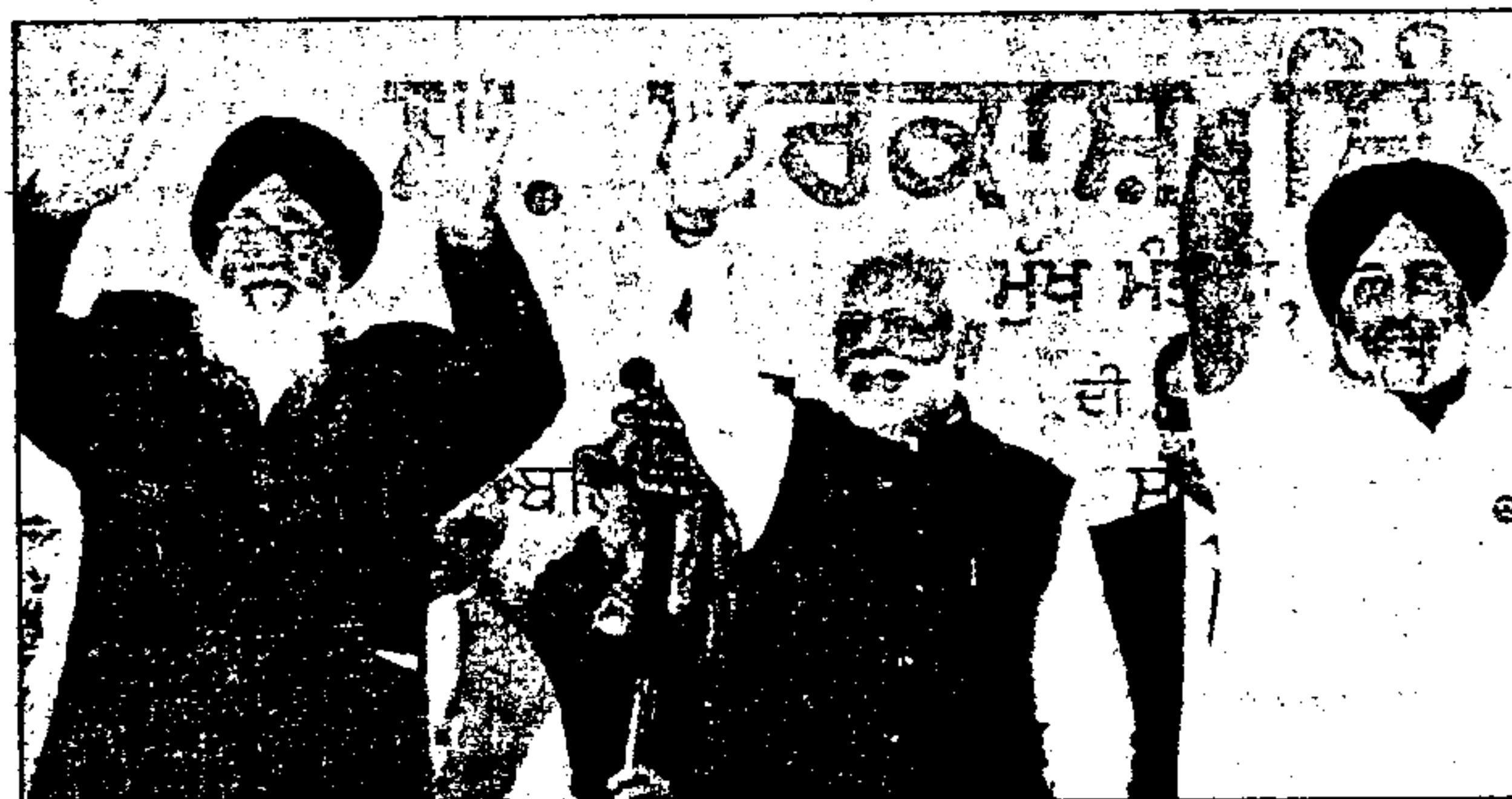
बटिंडा में शुक्रवार को रैली के दौरान प्रधानमंत्री नरेंद्र मोदी के साथ पंजाब के सीएम प्रकाश सिंह बादल और उपमुख्यमंत्री सुखबीर सिंह बादल।

कार्यबल का गठन : मोदी ने कहा कि सिंधु जल समझौते पर एक कार्यबल का गठन किया गया है ताकि सुनिश्चित किया