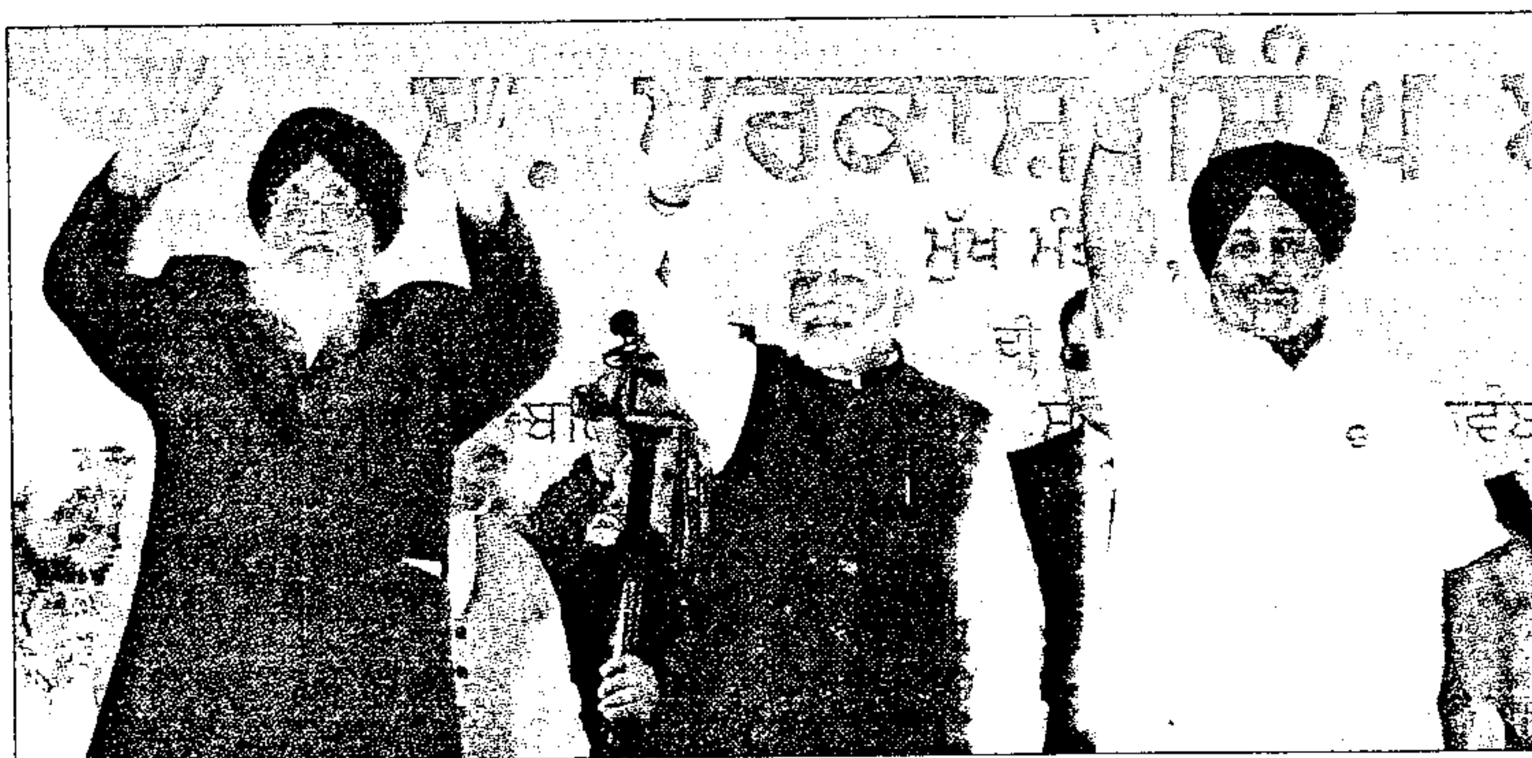
बठिंडा में एम्स के शिलान्यास समारोह के दौरान जनसभा में आए लोगों का अभिवादन करते प्रधानमंत्री नरेन्द्र मोदी, पंजाब के सीएम प्रकाश सिंह बादल और उपमुख्यमंत्री सुखबीर सिंह बादल।