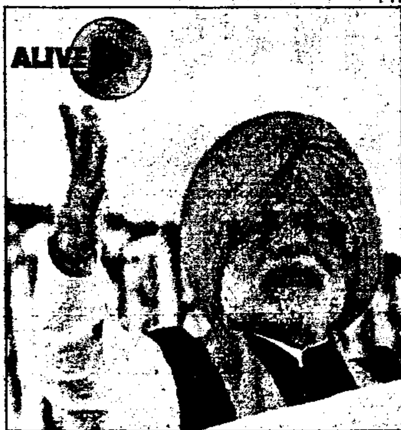
PM Narendra Modi addresses an event to mark the 350th birth anniversary of Shri Guru Gobind Singh at Anandpur Sahib Gurudwara in Punjab on Friday

Modi skirted the touchy issue of Satluj-Yamuna Link (SYL) canal and said that a task force had been set up to find ways to stop river waters from flowing into Pakistan. "The task force is working under the Indus Water Treaty," he said. "A lot of water is flowing from rivers in India which is going