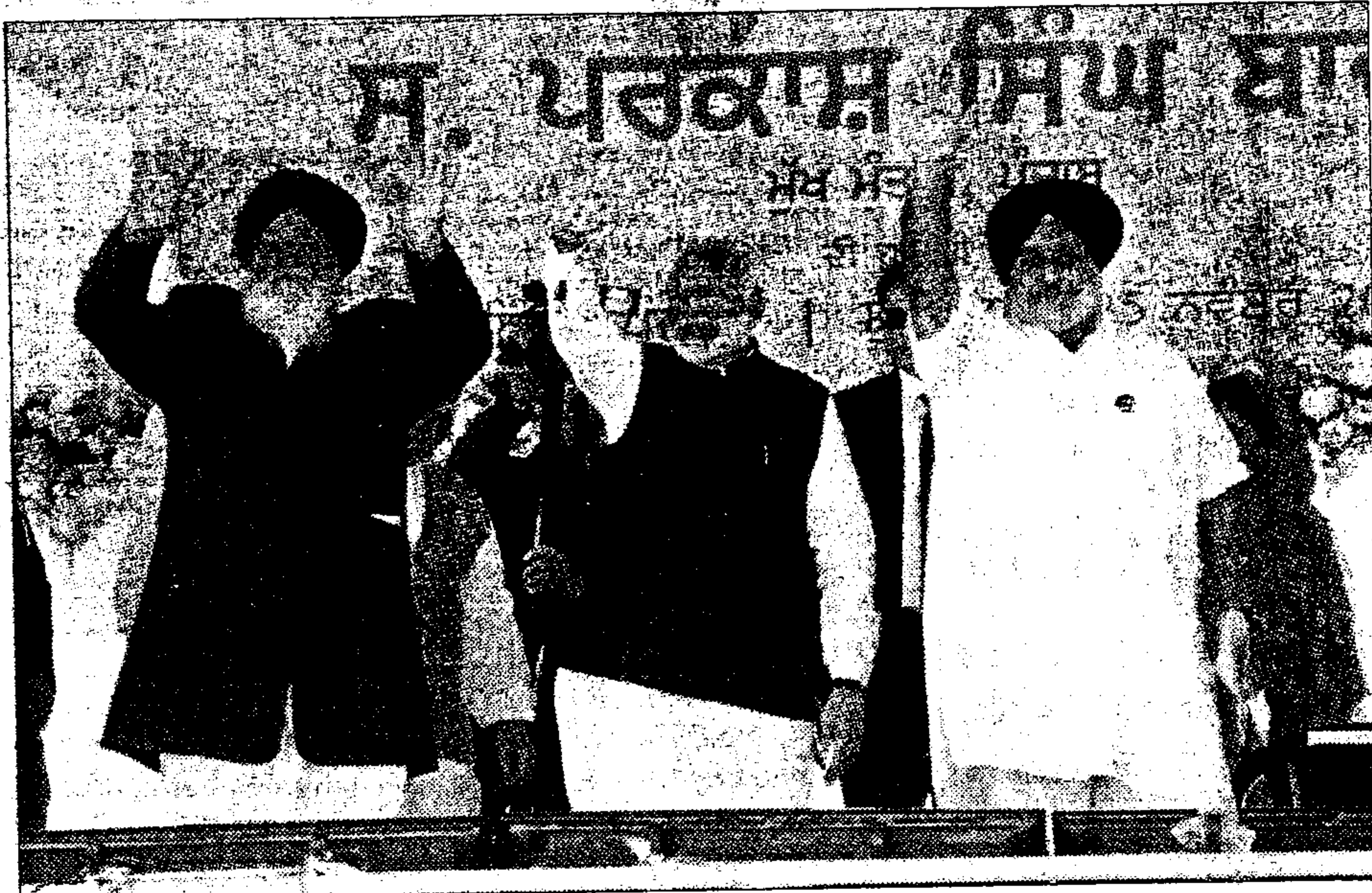
Chief Minister Parkash Singh Badal, Prime Minister Narendra Modi and Deputy CM Sukhbir Badal in Bathinda on Friday.

Punjab BJP chief Vijay Sampla said flights would take off from Adampur and Bathinda airports shortly.