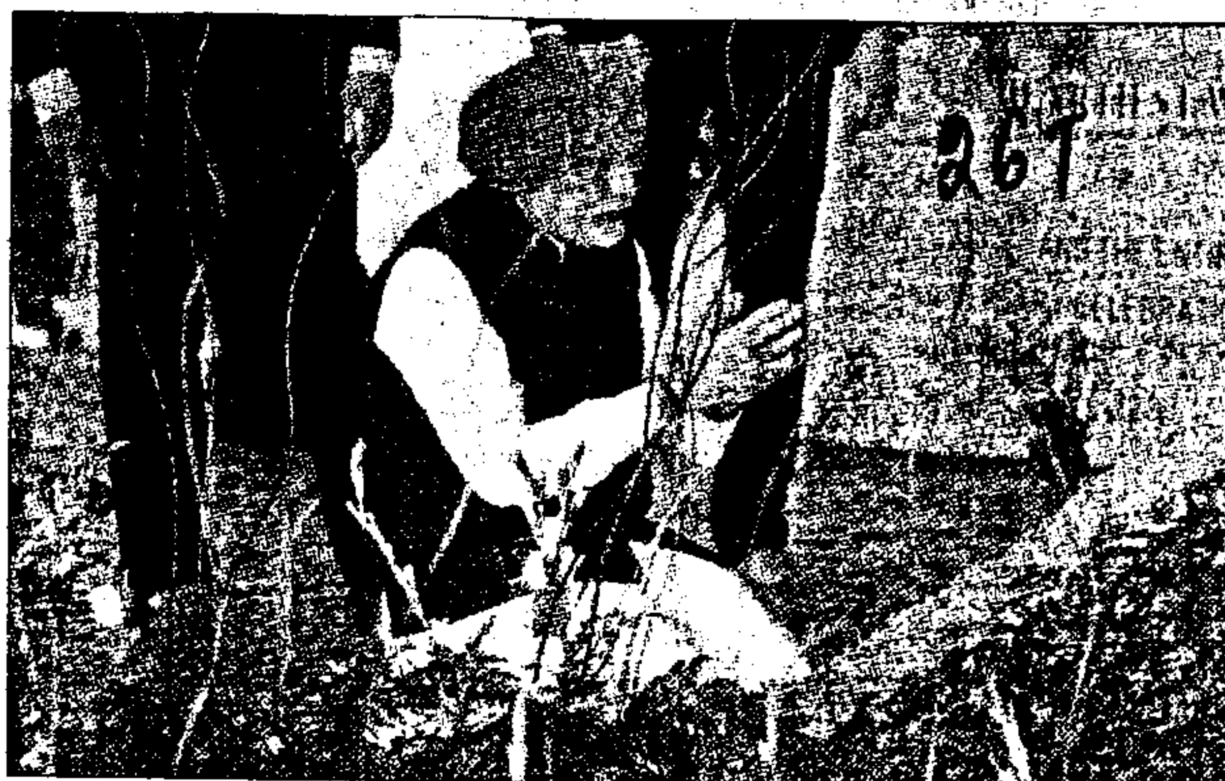
PM Narendra Modi pays obeisance during 350th birth anniversary celebrations of Guru Gobind Singh at Anandpur Sahib.

Referring to the shortage of irrigation water in North India and the Indus Water Treaty with Pakistan, Modi said: "I will bring the Indus, Ravi and Sutlej waters, flowing to the Arabian Sea through Pakistan, back to India for farmers of Punjab and Jammu and Kashmir. Pakistan is not using even a drop of water of the two rivers