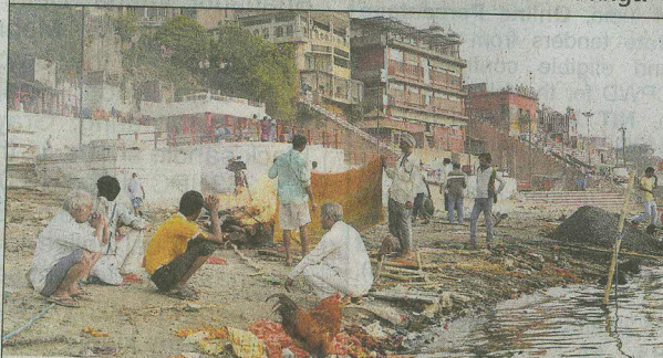
The polluted banks of the Ganga.

Centre has allotted Rs.20,000 cr. to restore Ganga