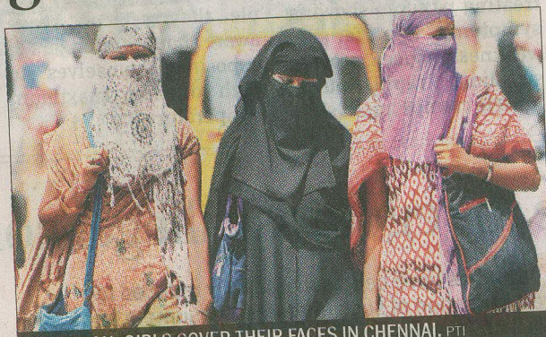
HEAT IS ON: GIRLS COVER THEIR FACES IN CHENNAI.

The onset at Kerala will change the weather pattern and provide southern parts the much-needed respite from the severe heatwave.