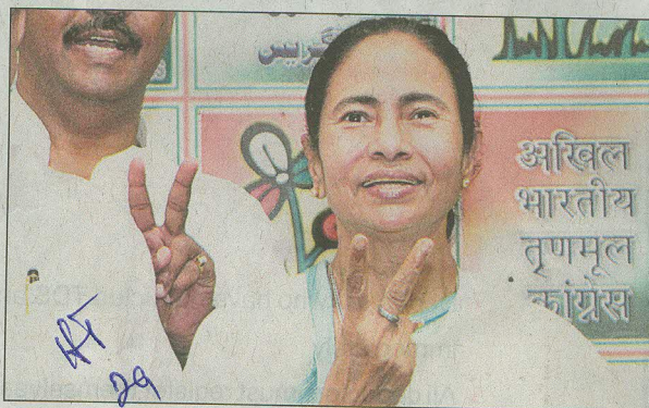
■ West Bengal chief minister Mamata Banerjee

Sources in the Trinamool said the announcement is aimed to clarify that Banerjee will